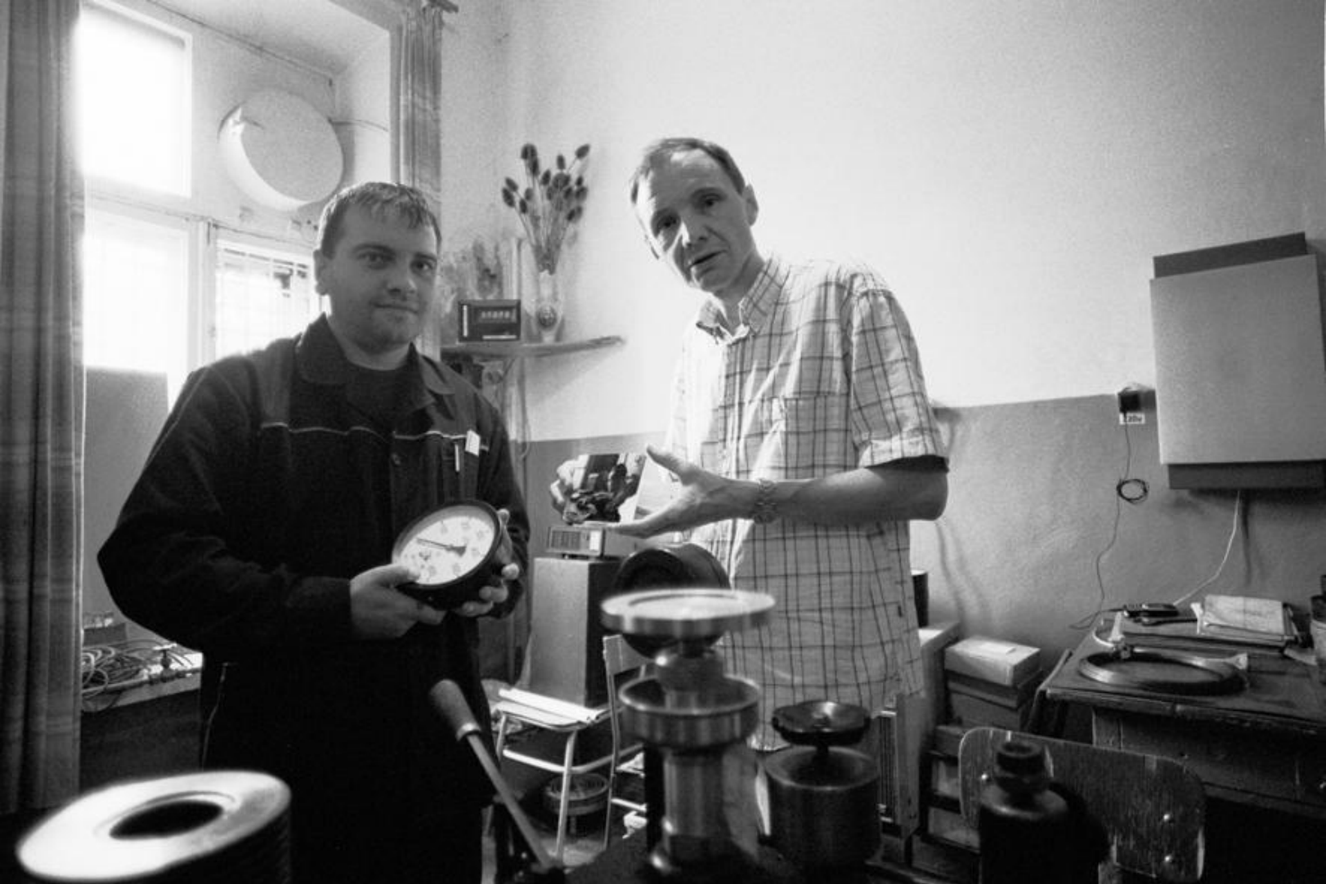
Spotkanie w warsztacie z pracującym tu mechanikiem precyzyjnym.