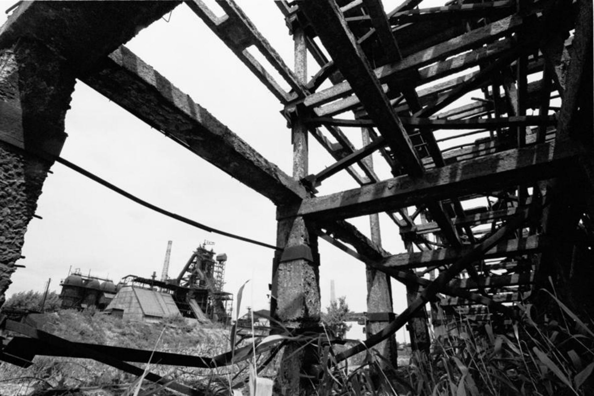
Na terenie Huty Kramatorska im. W. W. Kujbyszewa.