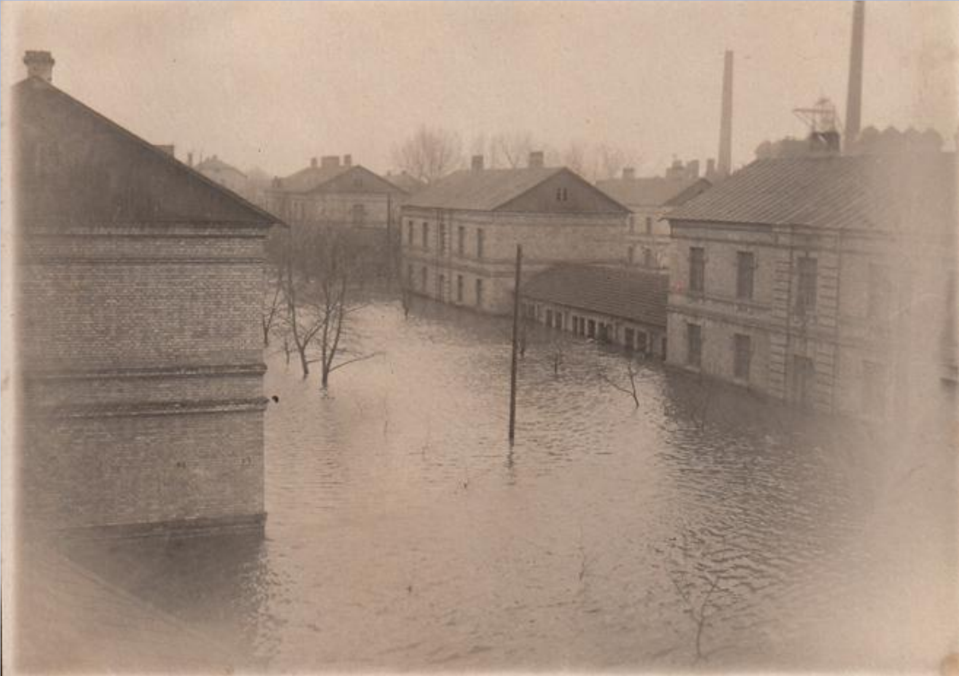
Powódź Starego Miasta – Kramatorsk lata 30. XX wieku.