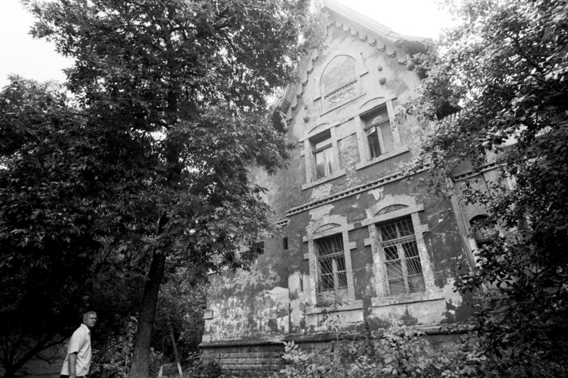
Willa byłego niemieckiego przemysłowca Protse, później siedziba NKWD, nazistowskiego Gestapo, miejskiego posterunku policji nr 1 ul. Klubnaya za Domem Kultury im. Lenina na Starym Mieście.

Kramatorsk, lipiec 2008 r., foto Jerzy Karnasiewicz